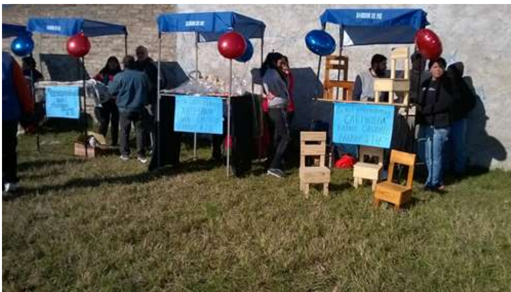
Figura 6. Feria de Microemprendimientos. Pueden observarse la exposición de trabajos realizados por los militantes del Movimiento Barrios de Pie: carpintería y artesanías. González Catán, 14 de junio de 2016.

viabilizaban la existencia de la organización pues con ellos resolvieron las situaciones de urgencia que se les presentaban a las familias desempleadas. Esta situación nos reenvió a nuestro marco teórico cuando se planteaba que uno de los conflictos a los que se veían enfrentados los vecinos de los barrios populares era la tensión entre la urgencia y el proyecto: “Por un lado hubo que obtener “Planes Trabajar”, subsidios, recursos para el barrio y para la organización (la urgencia). Por el otro fue necesario articular una demanda por trabajo, la necesidad de sostener un proyecto común de desarrollo autónomo, las críticas al gobierno, a los partidos políticos y al Estado respecto del modelo de sociedad que los excluía (el proyecto)”. (Merklen, 2010, pág.21).