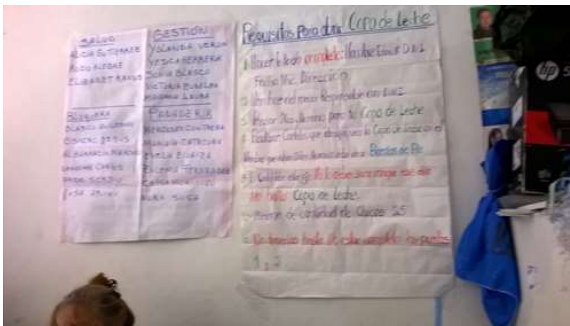
Figura 3. Requisitos para abrir una copa de leche. González Catán, 24 de mayo de 2016.