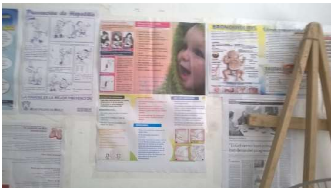
Figura 2. Promoción de la salud infantil. Local de Barrios de Pie en González Catán, 7 de enero de 2016.

2016). “Nosotros hacemos talleres de Salud, hay promotoras que se les enseña a medir, a pesar a los chicos para ver si están desnutridos”. (García, comunicación personal, 7 de enero de 2016).