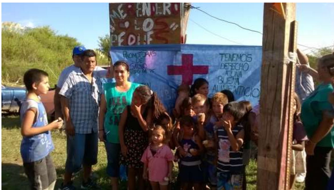
Figura 4. Colocación del cartel para la inauguración de la copa de leche. Asentamiento La Celeste, 22 de febrero de 2016.

según lo acordado en la reunión del 28 de enero, dos Promotoras de Salud cuya función fue la de medir y pesar a los infantes y jóvenes que asistieron al merendero.