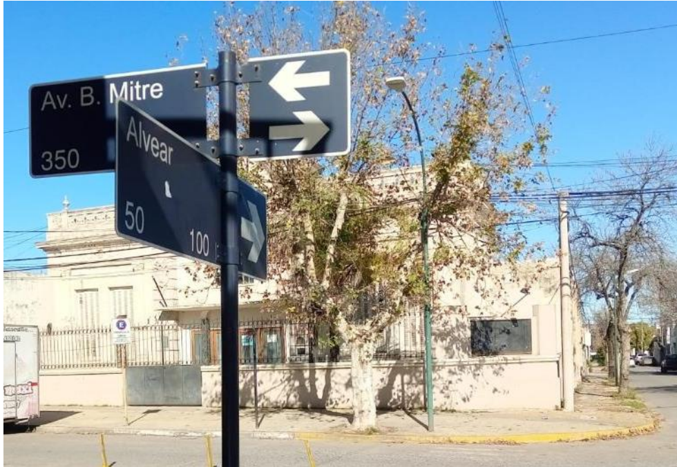
Figura 2. Salto. Una chapa señalizadora de la avenida Mitre. Al fondo, edificio de la sociedad francesa.

Que, siempre estamos a tiempo de enmendar nuestros errores y equivocaciones ... (Ordenanza n°106, 2009)