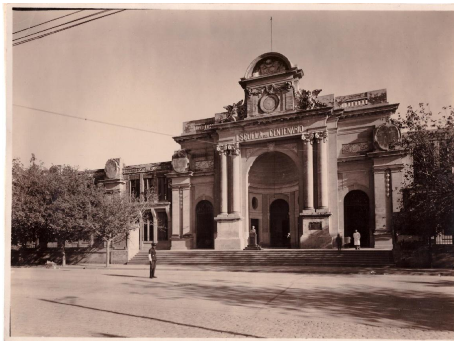
Figura 1. Escuela del Centenario.

El presente artículo pretende desandar desde el análisis del discurso algunas categorías teóricas propuestas por el entonces gobernador de Santiago del Estero, Antenor Álvarez, en ocasión de dejar inaugurado el edificio de la Escuela del Centenario y la Biblioteca del Estado en 1916 (la Biblioteca 9 de Julio fue creada mediante ley n°500 del 28 de junio de 1915, inaugurada en octubre del siguiente año). En principio, recuperar estos discursos como fuente documental, para luego generar un análisis de los mismos desde un enfoque histórico nos permitió recuperar las impresiones del pasado nacional enunciadas por uno de los intelectuales provinciales de este período, y en otro sentido, las de un sujeto histórico en un rol político.